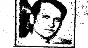
إلى جانب الفراق والمثل ، فقد بهتت في هذا العمر...